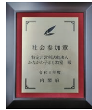
「社会参加章」と「記念の楯」