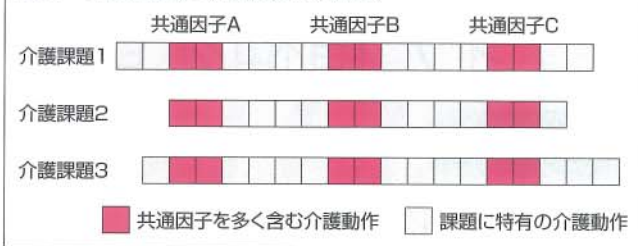
図2 介護課題と介護動作の関係

作の関係は、図2のようなものと考えられる。図は、個々の介護課題の遂行に必要な一連の介護動作の中に、共通因子を多く含む介護動作■と、それぞれの介護課題に特有の介護動作□があることを表している。