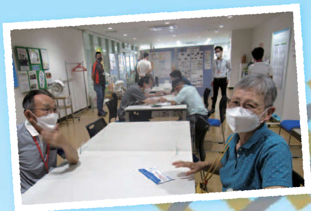
わかって安心、ほかのことも 聴けるのが嬉しい