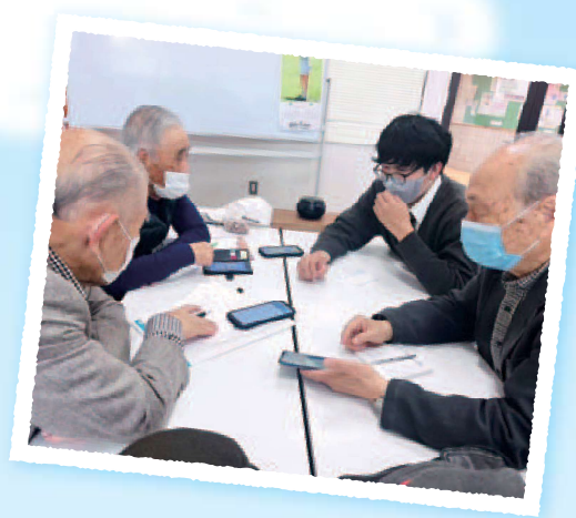
世代間でワイワイ、これも楽しい!