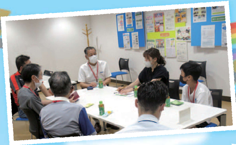
みんなで振り返る時間がとても大切 (横浜市泉区 いずみスマホよろず相談所)