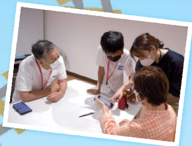
ボランティアにわからないことは、 一緒に調べて考える